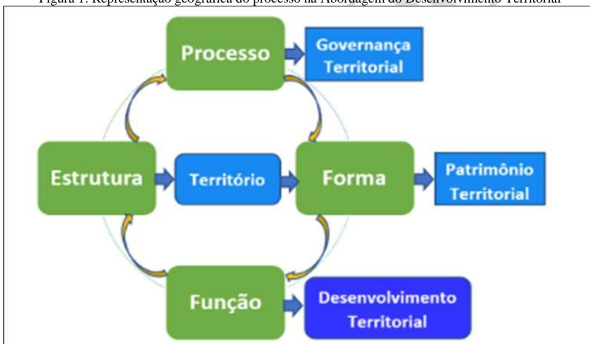
Figura 1: Representação geográfica do processo na Abordagem do Desenvolvimento Territorial

Essa interpretação visa propor uma nova perspectiva para o desenvolvimento territorial, valorizando o patrimônio local e promovendo uma governança mais inclusiva. O objetivo dessa interpretação é o de propor um referencial que permita explorar novas possibilidades na dinâmica de desenvolvimento local, com relevo na ativação do patrimônio territorial como estratégia central. Detalhamos as interações em quatro categorias: território, governança territorial, patrimônio territorial e desenvolvimento territorial. Aqui a ênfase recai sobre os processos inerentes ao desenvolvimento territorial (Dallabrida; Rotta; Büutenbender, 2021). A Figura 1 nos mostra a representação geográfica do processo na Abordagem do Desenvolvimento Territorial.